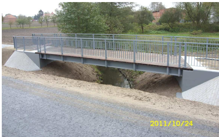
Kładka w ciągu ścieżki rowerowej przy drodze powiatowej nr 1546 C Bydgoszcz – Otorowo – droga wojewódzka nr 397

W ramach Narodowego Programu Przebudowy Dróg Lokalnych złożono wnioski o przyznanie dofinansowania dwóch inwestycji drogowych, zaplanowanych do realizacji w roku 2013. Oba wnioski zajęły czołowe miejsca na liście rankingowej dofinansowanych projektów. Przyznane środki w wys. 50% wartości zadania z całą pewnością zapewnią realizację obu projektów w planowanym okresie.