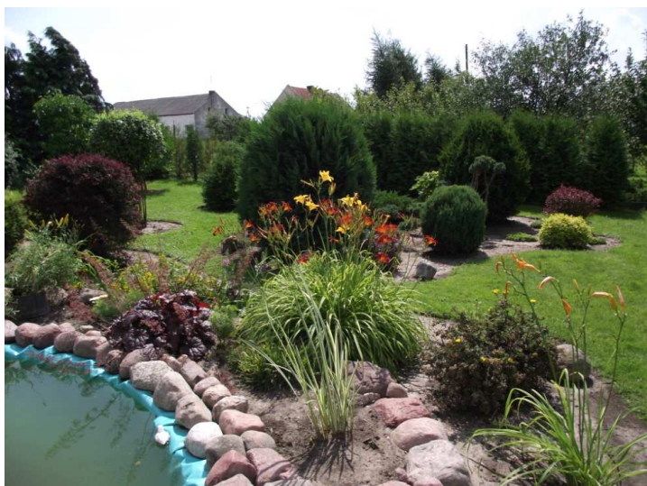
Ogród Jadwigi Zamiatąła – laureatka konkursu w 2012r.

powiatu do działań związanych z dbaniem o estetykę ogrodów przydomowych, co w następstwie ma swoje odbicie w ogólnym wyglądzie terenów zielonych w naszym regionie. Konkurs cieszy się coraz większą popularnością wśród mieszkańców.