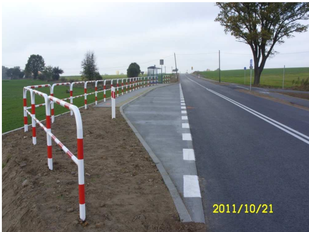
Przebudowana droga powiatowa nr 1527 C Prosperowo – Wojnowo

Realizacja niektórych inwestycji była możliwa dzięki środkom finansowym pozyskiwanym z zewnątrz, między innymi w ramach Narodowego Programu Przebudowy Dróg Lokalnych.